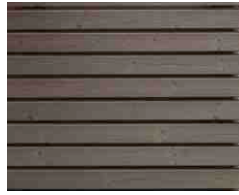
Thermo Kiefer aus Rhombuslatten 20/65 vorvergraut