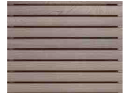
Thermo Esche aus Rhombuslatten 20/52 vorvergraut