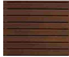
Thermo Esche aus Rhombuslatten 20/52 braun