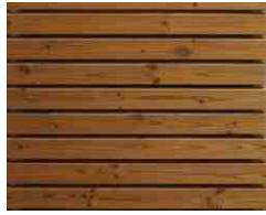
Thermo Kiefer aus Rhombuslatten 20/65 braun