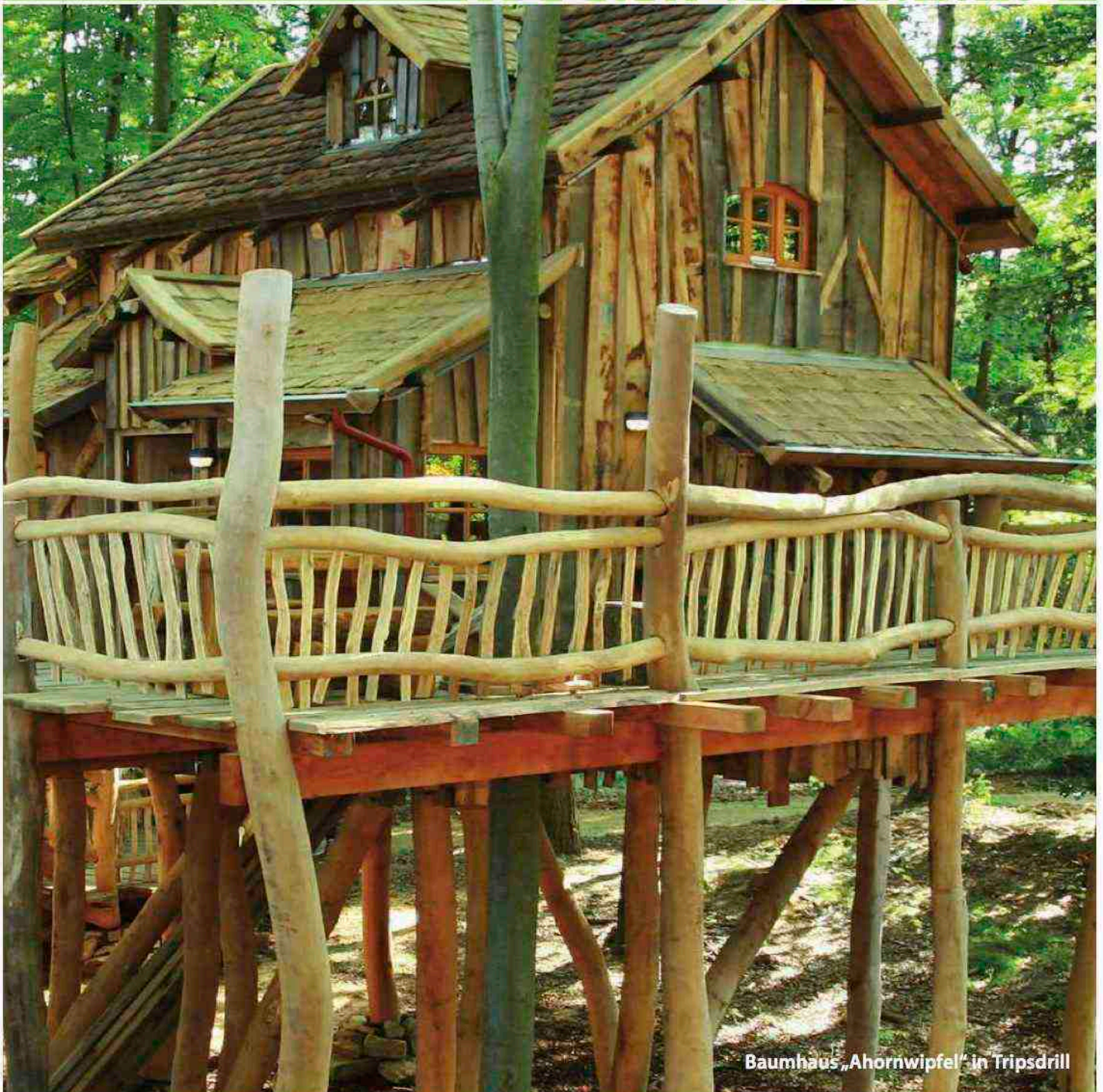
Baumhaus „Ahornwipfel“ in Tripsdrill